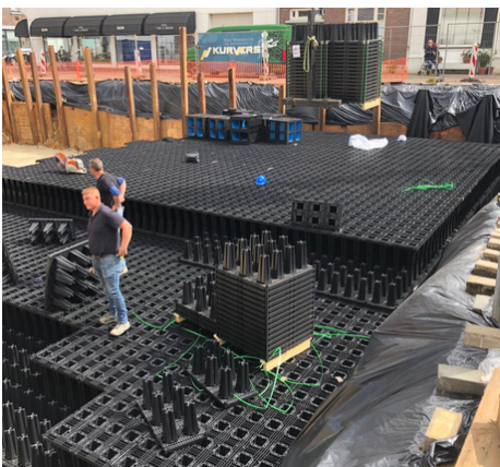
Hoog rendement bij plaatsing

Perfect gladde kragenbodem met 2mm sleufjes ter voorkoming van de verspreiding van sediment en vuil in het krattensysteem. 320m 3 kragen per vrachtlading, mogelijk dankzij makkelijk stapel systeem. Milieu en personeel vriendelijk door lichtgewicht en gebruik gerecycled materiaal of te recyclen materiaal.