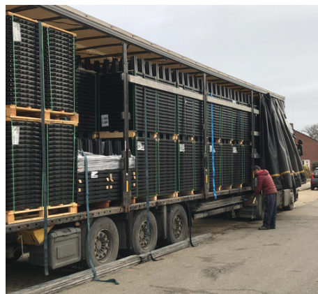
320m 3 per vrachtauto