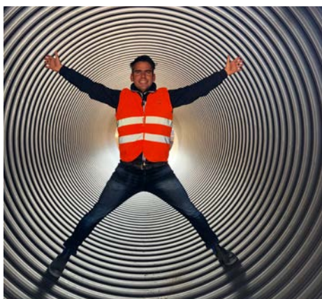
Zeer eenvoudig te inspecteren en reinigen - toegankelijk

In slechts 8 vrachtladingen en 8 losbewegingen met de op locatie geplaatste kraan werd in 2 dagen tijd deze volledig buffer geplaatst en in elkaar gelast. Door het lichtgewicht kan de constructie snel en efficiënt geplaatst worden (3500-5000 kg per lengte van 17 ml).