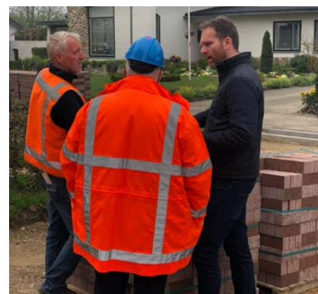
Uitleg op locatie

Afdeling Techniek +31 (0)6 10 33 84 78 Chris@ids-group.nl